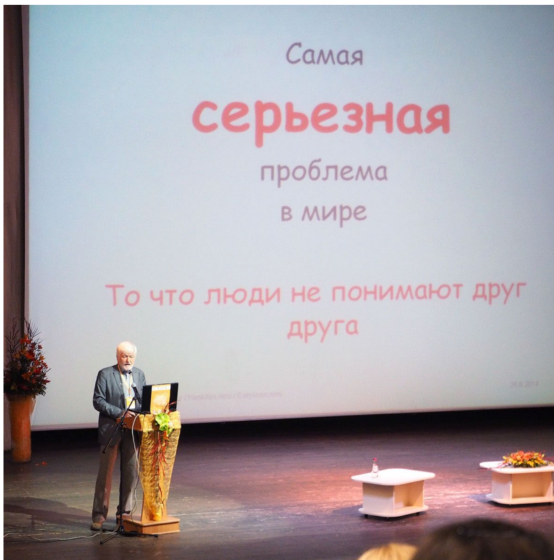
Рисунок 4. Арто Мустайоки читает лекцию «Коммуникативные неудачи через призму потребностей говорящего».

посвященный развитию познавательной деятельности дошкольников и младших школьников в связи с созреванием префронтальной коры головного мозга (Р.И. Мачинская).